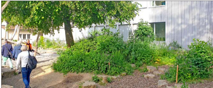
Die entsiegelten Flächen sind nun naturnah bepflanzt.

Ökogemeinde www.oekogemeinde.ch , info@oekogemeinde.ch Ökogemeinde Binningen, Gruppe Natur