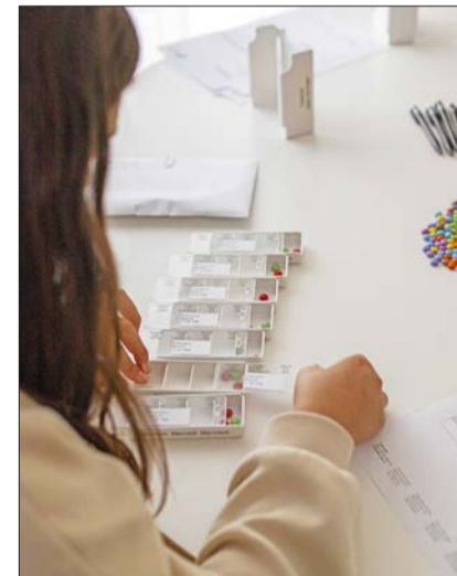
Bei verschiedenen Posten lernten die Schülerinnen und Schüler die Pflegeberufe und die Spitex ABS kennen.

Anfang Mai fand in der Schweiz die Woche der Berufsbildung statt, während der auch die Spitex Allschwil Binningen Schönenbuch als Ausbildungsbetrieb ihre Türen öffnete. Insgesamt 20 Schülerinnen und Schüler aus dem Kanton Baselland nutzten die Gelegenheit, die Pflegeberufe und die Spitex Allschwil Binningen Schönenbuch