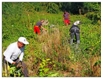
Mit Hilfe der Bevölkerung werden in der Region koordiniert Neophyten bekämpft.

In Kleingruppen werden an verschiedenen Standorten im Leimental Neophyten bekämpft.