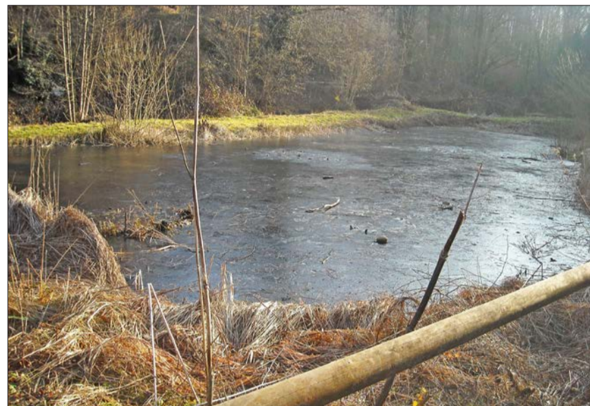
Huj Die Sonne spiegelt sich auf den Eisflächen.

Anwesenden. Die vorgesehenen Arbeiten werden kurz aufgezeigt. Es gilt die Tümpel entlang des Weierbaches vom Schlick zu befreien. Die mit Schlamm aufgefüllten Wasserstellen müssen ausgeräumt werden, damit sie im Frühjahr für Frösche und Kröten als Laichplatz dienen können. Eher eine mühsame Arbeit. Dank dem Einsatz eines Baggers der Firma Alabor, konnte ein grösserer Weiher gereinigt werden. Beim nächsten Einsatz werden an diesem Ort weitere Tümpel vom Schlick befreit und für die Amphibien bereitgestellt. Es geht gegen den Samstag Mittag. Die Sonne wärmt doch etwas mehr. Eine Stärkung und Getränke stehen bei der Hütte im Naturschutzgebiet bereit. Gestärkt und sichtlich zufrieden machen sich die Helfer auf den Heimweg.