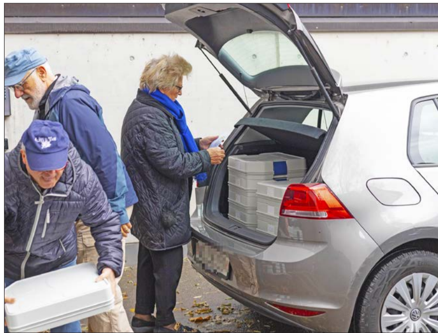
Anhand des Tourenplans werden die Boxen auf vier Autos verteilt.