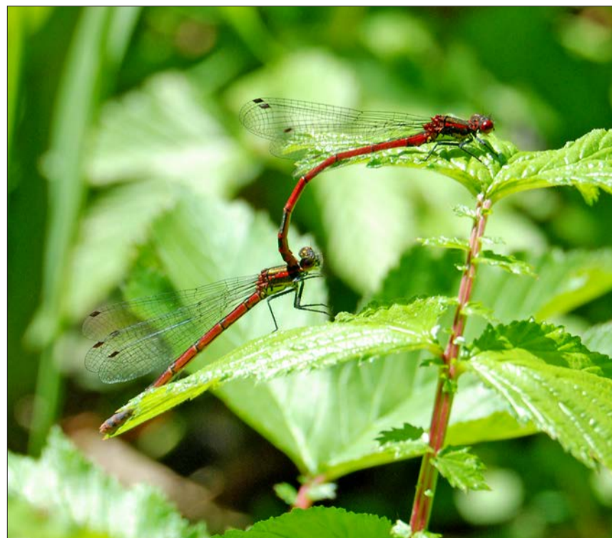
Die Frühe Adonislilibe ist bereits zeitig im Jahr an den Gewässern anzutreffen. Hier hat sich ein Männchen ein Weibchen gepackt.

Leimental: Herzogenmatt (Binningen), Weiheranlage Mooswasen (Therwil) Birstal: Ermitage (Arlesheim), Angenstein Schlossweiher (Duggingen) Ergolz: Talweiher (Anwil), Weiher Mergelgrube (Rothenfluh) Laufental: Birshollen (Laufen), Chastelmatte (Grellingen)