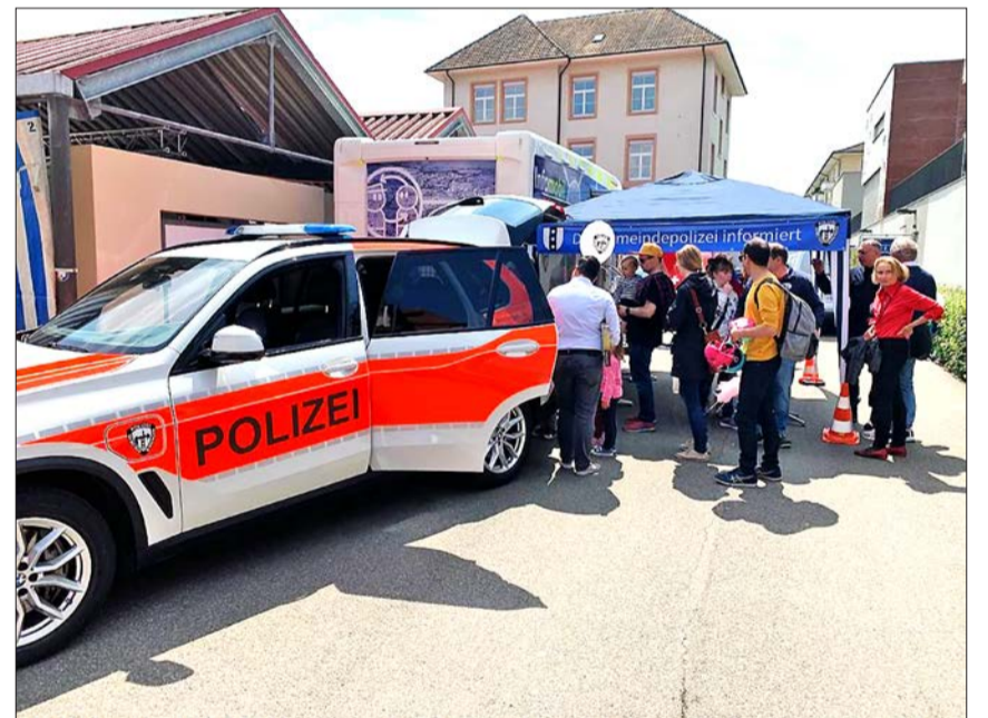
Die erste Teilnahme am Frühjahrmärt Binningen war für die Gemeindepolizei ein voller Erfolg.

Wir wünschen allen Badbesucherinnen und Badbesuchern eine schöne Gartenbad-Saison.