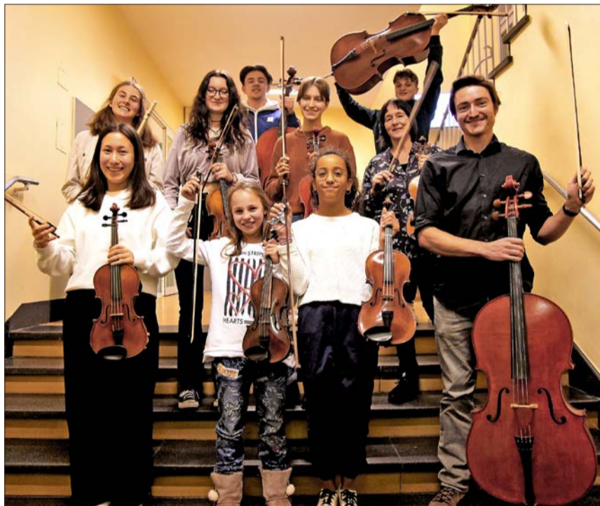
Die BiBoPlayers reisen im Mai zum European Youth Music Festival Remix22 nach Luxembourg.

Freitag, 13. Mai 2022, 19.00 Uhr, Kronenmattsaal, Binningen