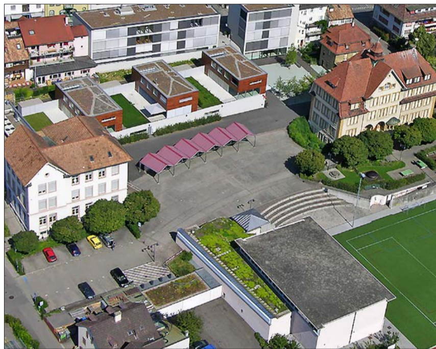
Für die Erweiterung des Schulcampus Dorf hat der Gemeinderat auf Wunsch des Einwohnerrats zwei Ausführungsvarianten erarbeitet.

Der Gemeinderat erachtet das ursprüngliche und nun optimiert vorliegende Projekt weiterhin als grosse Chance für Binningen, welches zur Belebung und Stärkung des Dorfkerns beiträgt. Mit den diversen Grün- und Freiflächen, der Infrastruktur für Sport und Veranstaltungen, der Aufwertung des Dorfplatzes sowie den zusätzlichen öffentlichen Parkplätzen und Schutzplätzen für die Bevölkerung kann mit der Projektvariante «optimiert» nicht nur der dringend benötigte zusätzliche Schulraum realisiert werden, sondern auch weitere wichtige Bedürfnisse der Bevölkerung. Aus Sicht des Gemeinderates bietet die Variante «optimiert» mit dem Einbezug der Curt Goetz-Strasse in die Umgebungsgestaltung und den zu-