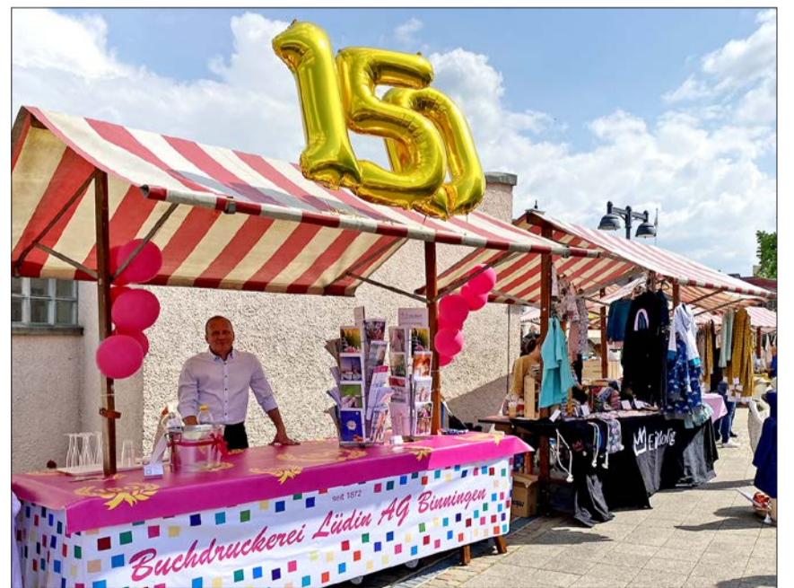
Erstmals am Markt dabei war die Buchdruckerei Lüdin AG, Redaktion und Verlag des Binninger Anzeigers, anlässlich ihres 150jährigen Firmenjubiläums. schw

Kurz zusammengefasst war es wieder ein wunderschöner Markt, bei prächtigstem Frühlingswetter, welcher für jede und jeden etwas zu bieten hatte.