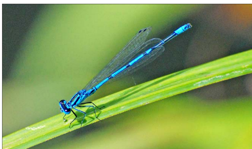
Die Hufeisen-Azurjungfer mit dem arttypischen Symbol auf dem ersten Segment des Hinterleibs direkt hinter den Flügelansätzen.

Männerhandball (1. Liga): HSG Leimental - Pfader Neuhausen 41:25 (19:10)