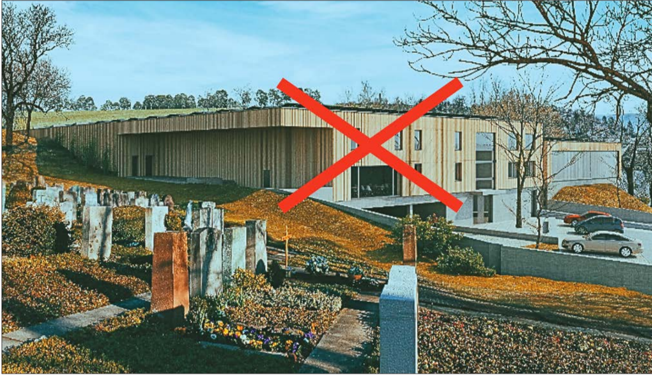
Der geplante Werkhofneubau unmittelbar neben den Gräbern (Bild ist der Visualisierung der Vorlage des Gemeinderates entnommen)

Das Komitee «Kein Werkhof am Friedhof!» lehnt den Standort neben Kirche und Gräbern ab. Es braucht keinen neuen Standort. Der bestehende, zentral gelegene Werkhof kann mit geringem Aufwand saniert und modernisiert werden. Der geplante Werkhofneubau am Friedhof ist eindeutig am falschen Ort, zu gross dimensioniert und mit CHF 13.3 Mio., zu teuer.