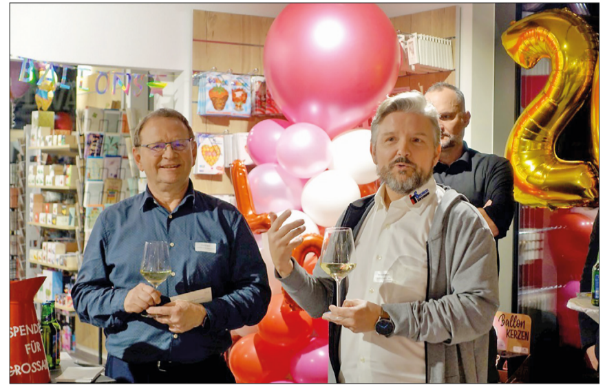
Impressionen vom Neujahrsapéro