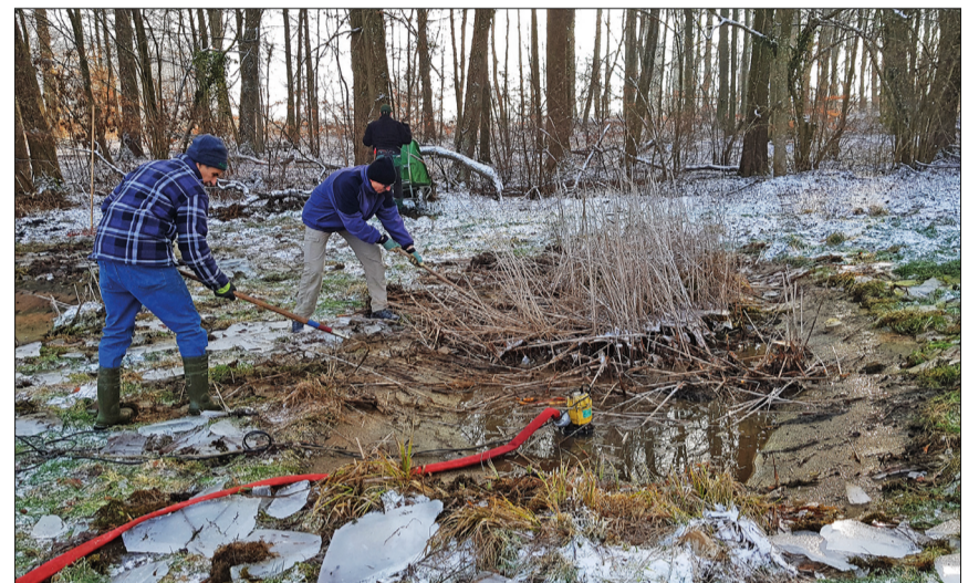
Ein Trittsteinbiotop musste gereinigt werden. Zuerst wurde die Eisschicht entfernt. Dann wurde das Wasser mit einer Pumpe entleert.

jetzt konnte das Ausräumen der Pflanz- und der Erdschicht beginnen. Weil die Weiher sonst verlanden und so für Kröten, Frösche usw. nicht mehr als Lebensraum dienen würden, ist diese Pflege notwendig. Dank den Betonbecken ist diese Arbeit mit kleinem Aufwand möglich. Die Vernetzung der Herzogenmatt entlang des Dorenbachs und des Weierbachs ist notwendig. Wir