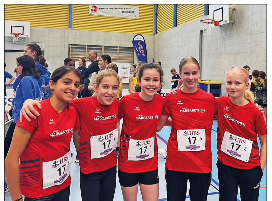
U14 Girls-Team am Kids Cup in Therwil