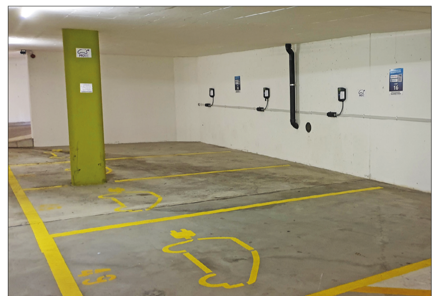
In Binningen wurden bereits einige öffentliche Ladestationen eingerichtet (hier beim Parking Schloss). Noch praktischer ist eine eigene Ladestation zu Hause.

Was im Einfamilienhaus in der Regel keine grössere Herausforderung darstellt, ist für Bewohnerinnen und Bewohner von Mehrparteienhäusern nicht ganz einfach zu realisieren, denn sie können nicht alleine entscheiden. Das Thema muss an einer Eigentümerversammlung mit den anderen Parteien besprochen werden oder man muss mit seinem Anliegen bei der Verwaltung vorsprechen. Doch was muss genau installiert werden? Müssen sofort alle Parkplätze mit Ladestationen ausgerüstet werden, obwohl viele noch kein Elektroauto besitzen? Wie wird der Strombezug fürs Laden abgerechnet?