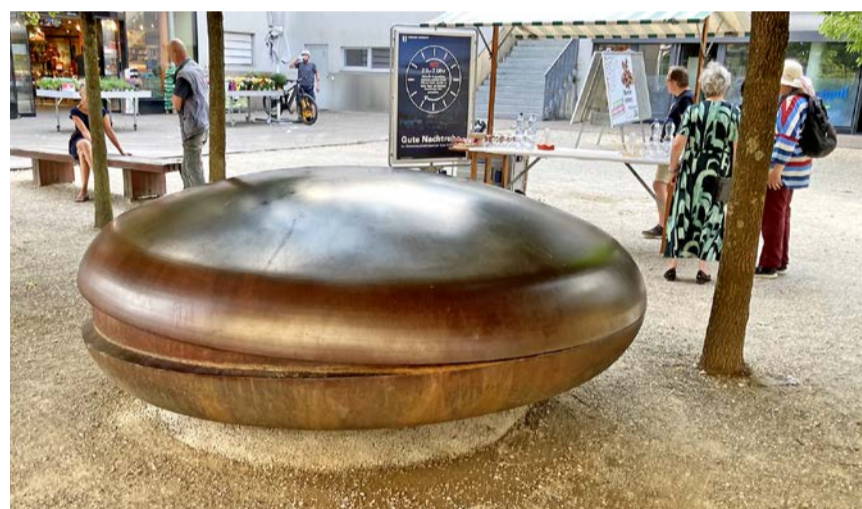
Die Skulptur, aus zwei Teilen zusammenschraubt stellt einen sich spaltenden Kern dar.

Bei den Kindern ist die Skulptur sehr beliebt, sie wird auch «heisser Hamburger» genannt. Vom ursprünglichen