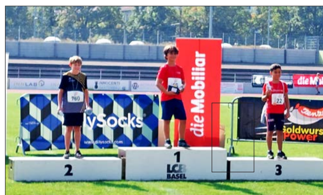
Evans gewinnt Bronze