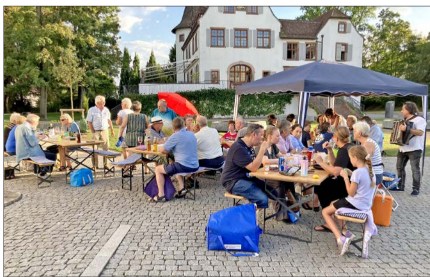
Impressionen vom Dienstagabend